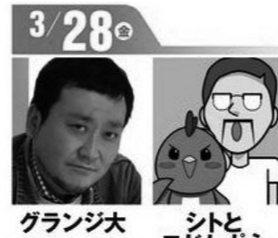
グランジ大 シトとエドセボネ