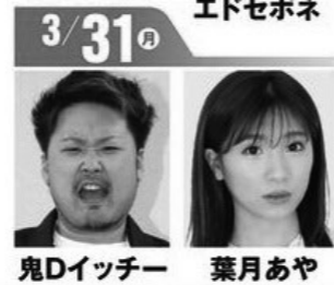
鬼Dイチー 葉月あや